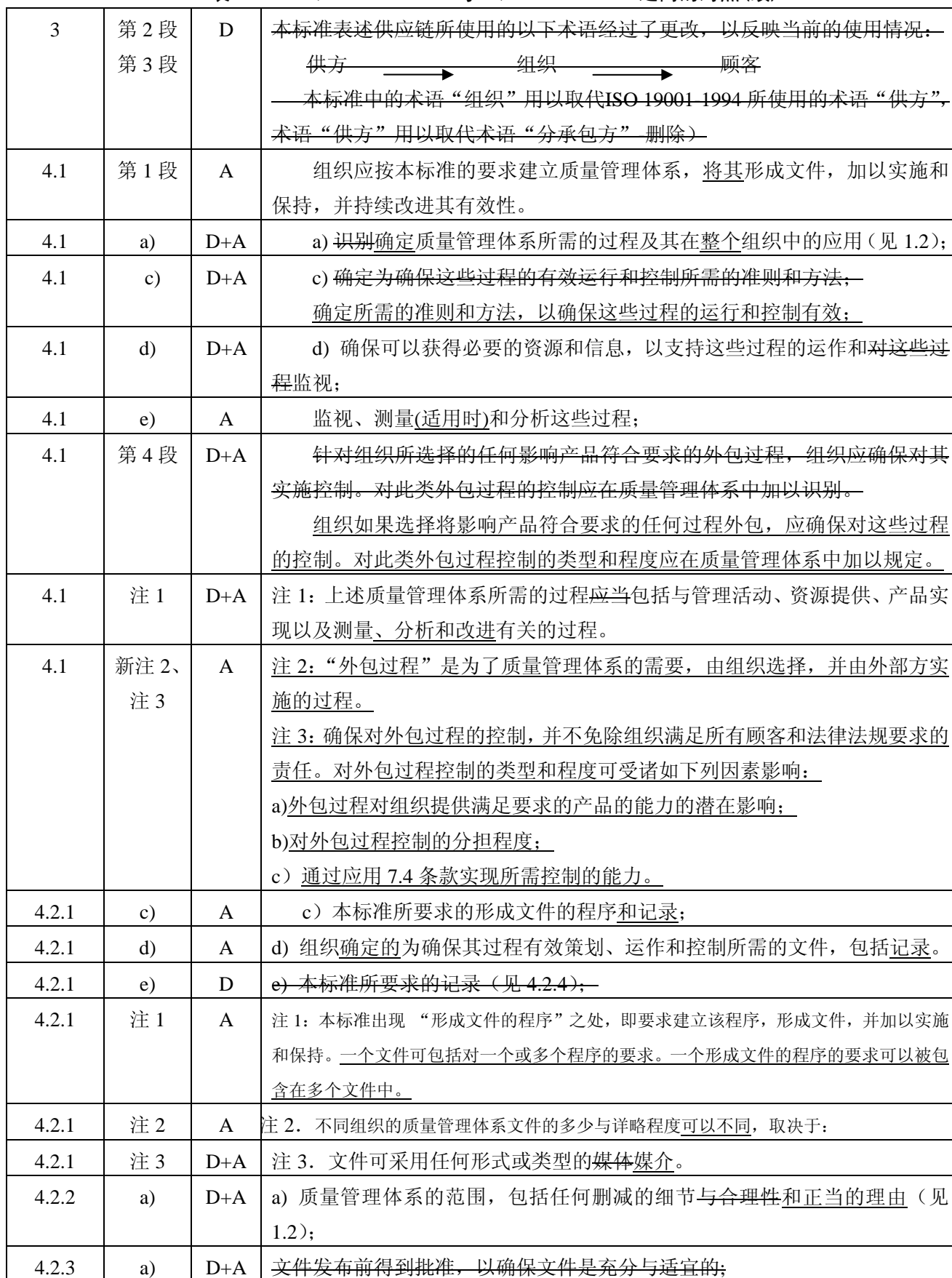
表 B.1 - GB/T 19001-2000 与 GB/T 19001-2008 之间的对照(续)